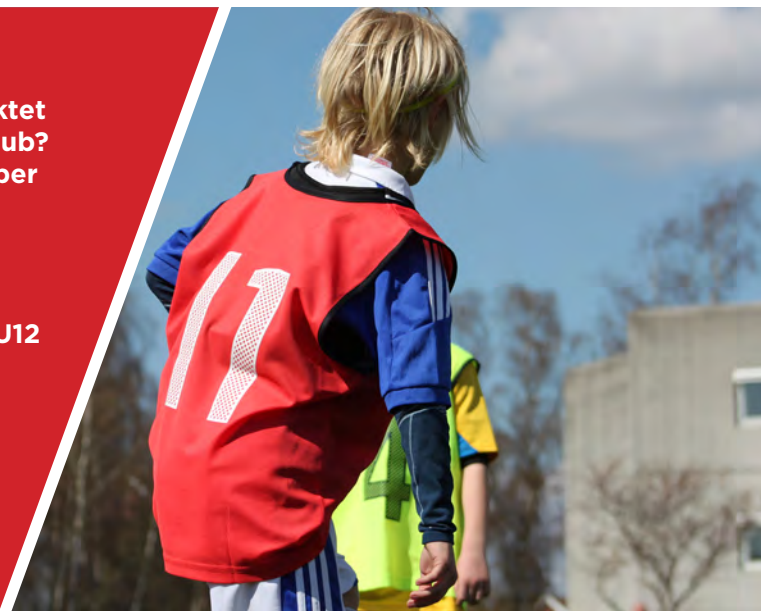
UDVIKLINGSORIENTERED E TRÆNINGSMILJØER