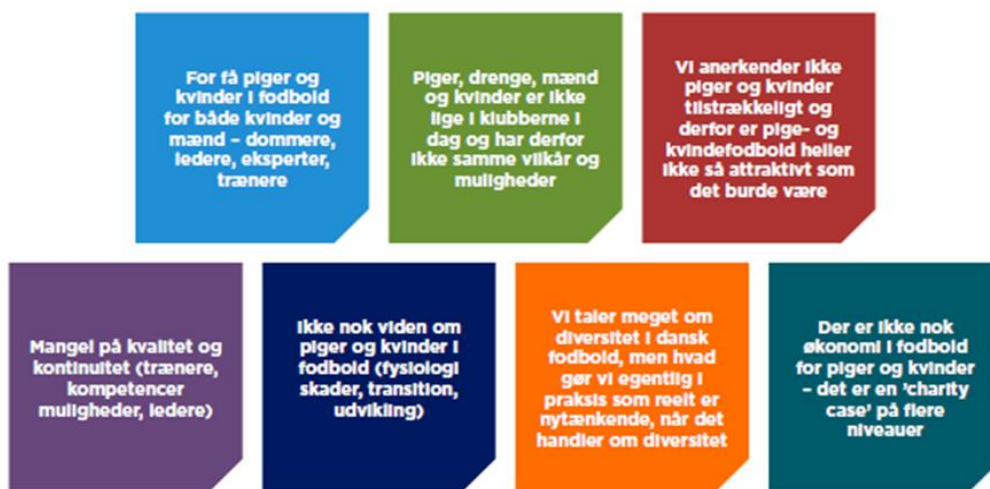
Figur ovenfor: De 7 barrierer for udviklingen er blevet til på baggrund af grundigt forarbejde, analyse og data – disse udspecificeres på Udviklingsplanens side 13 'Bilag A'

(Identificeret ved analytisk forarbejde)